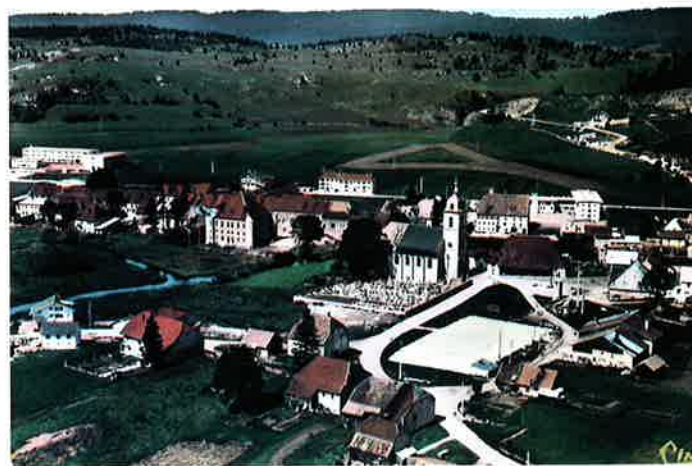
▲ La Serve aménagée avec l'emplacement de la patinoire et du terrain de boules.