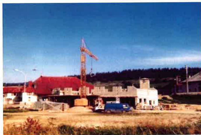
▲ La construction du centre de secours en 1976.

tous usages. Nous avions également une moto pompe portative fixée sur un traineau. L'ensemble permettait d'accéder aux différents points de puisage quand il y avait beaucoup de neige. La pompe était équipée d'un moteur de peugeot 203. Nous l'avons utilisée à Besançon lors des inondations de 1990, désolidarisée du traineau, elle nous a permis d'aller dans des endroits inaccessibles telles que les arrière-cours. Depuis 1992, elle est au Musée Départemental des Sapeurs Pompiers à Thoiry dans le pays de Gex. » Michel Cannelle nous raconte : « En devenant centre de secours, nous avons été dotés en plus d'un fourgon pompe tonne léger et d'une ambulance. Ce matériel a été abrité dans l'ancien hangar des machines du tacot appelé aussi la petite gare situé à l'emplacement actuel de la station service Atac. Les véhicules étaient rangés en enfilade et en cas d'incendie, il fallait sortir l'ambulance d'abord. C'est le premier local où nous pouvions ranger nos tenues entre