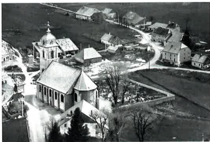
▲ La Serve en 1959. On aperçoit la fontaine couverte, les deux remises en bois et le vieux chalet. On distingue aussi le petit pont et le ruisseau de la Serve.