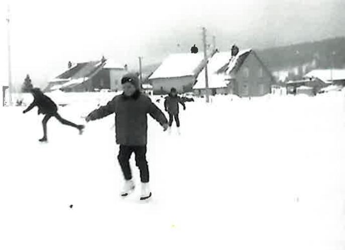
▲ La patinoire de la Serve janvier 1965.